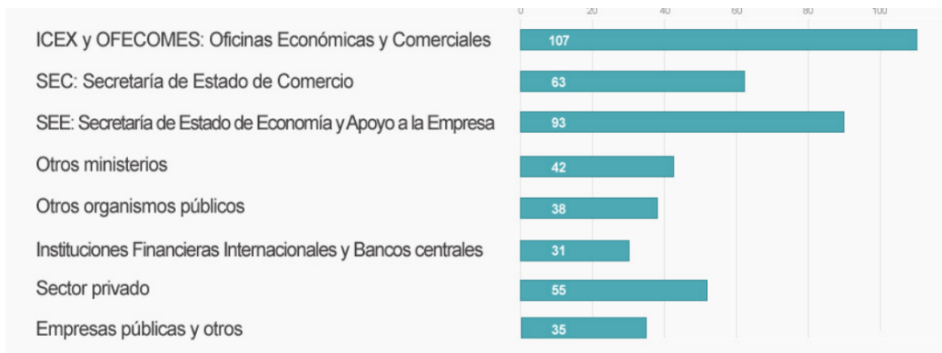
Distribución por destino de los TCEE en activo

La distribución por destinos muestra el predominio de la actividad de promoción comercial y apoyo a la internacionalización, en ICEX o en Oficinas Comerciales, 107, así como en la S.E. de Comercio, 63. En segundo lugar, figuran los destinos en la SE de Economía y Apoyo a la Empresa, 93. Otros ministerios no económicos y organismos públicos atraen a 42 TCEE y las IFIS a 31, mientras que 55 están trabajando en el sector privado.