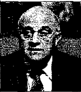
José Oliu Presidente del Banco Sabadell

La competencia es buena porque obliga a superarnos y a mejorar sin cesar. La posición competitiva es la que permite, en nuestro mundo financiero, desafiar las épocas turbulentas con garantías de éxito, porque quienes son o somos más eficientes están mejor preparados para afrontar retos de cualquier signo. La solidez de los balances y el rigor profesional de nuestros colaboradores son cruciales en épocas de crisis económica como la actual, como también lo son en épocas de bonanza.