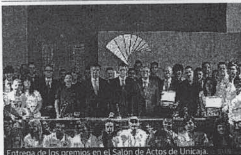
Entrega de los premios en el Salón de Actos de Unicaja.